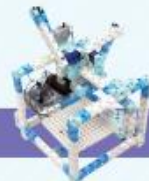
レベル12 ブロックキャッチャー