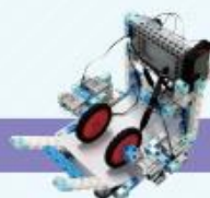
レベル11 お絵かきロボット