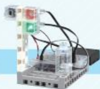
レベル1 信号機をつくらう