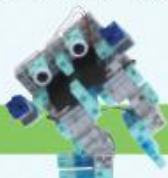
レベル6 2足歩行ロボット