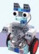
レベル9 ペットロボット