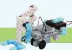
レベル5 フォークリフト