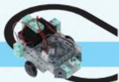
レベル2 ライトレース自動車