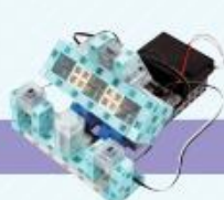
レベル10 音と光のリズムゲーム