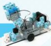
レベル3 アーム付き搬送ロボット