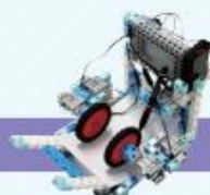
レベル11 お絵かきロボット