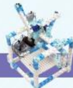
レベル12 ブロックキャッチャー