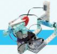
レベル4 紙飛行機発射ロボット