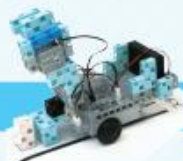
レベル3 アーム付き搬送ロボット